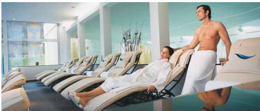
Ruheliegen und Harmonie im neugestalteten Badebereich

Vier Luxusmassageräume stehen desweiteren bereit, um den Gast mit einer exklusiven Auswahl an klassischen Massagen und Luxusbehandlungen zu verwöhnen. Ergänzt werden die Räume übrigen