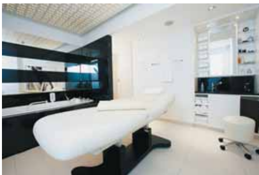
Niance Men Suite: Pure Verwöhnung für den Mann