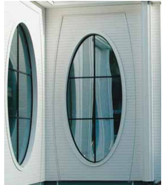
Markanter Stil durch die ellipsenartigen Fenster

Die aussergewöhnliche Architektur und der natürliche Baustoff Holz. Die Verwendung von Holz verleiht unserem Thermalbad eine unvergleichliche Wohlfühlatmosphäre. Heimelig, geborgen, hell und leicht soll der Badegast seinen Aufenthalt empfin-