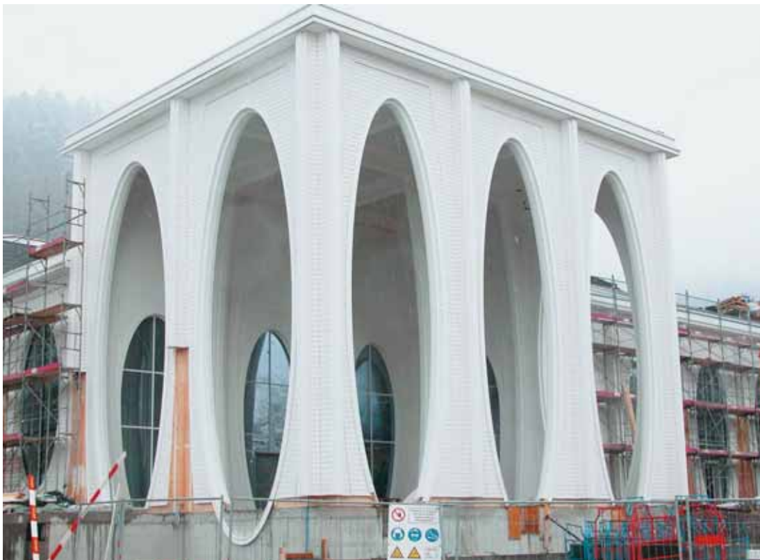
Beeindruckende Endmontage der vorproduzierten Holzelemente

Die eigentliche Formgebung der Therme erfolgt durch statische Trägerwände, auf die wiederum