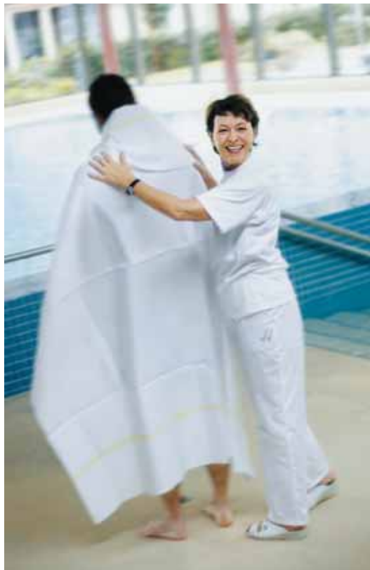
Ein warmes Badetuch für Körper, Geist und Seele

In der Eingangshalle rundet ein Shop für sportliche Freizeitbekleidung und Bademoden und ein weiteres Restaurant das Gesamtangebot ab. Der Halle ebenfalls angeschlossen ist der direkte Zugang des Medizinischen Zentrums.