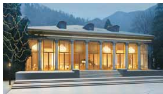
Bernhard Simon Saal mit grosser Glasfront

und Serviceabläufe konnte die Qualität für den Gast in jeder Hinsicht gesteigert werden. Insgesamt laden im Kursaal Business & Event Center acht Säle mit Tageslicht, ein Board Room und eine VIP-Lounge zum Tagen, Feiern oder Konzertieren ein.