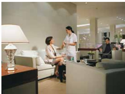
Einladend – der Empfangsbereich im To B. Beauty & Care

In der dritten Sektion des To B. Wellbeing & Spa begeistern seit kurzem acht lichtdurchflutete Räume für Schönheitsbehandlungen mit Wintergarten-Atmosphäre und neuer Grosszügigkeit. Hier geniessen die Gäste exklusive Beauty-Treatments mit internationalen Luxuskosmetiklinien. Für die anschliessende Entspannung steht den Gästen die Wärme-Wasser-Liege in der neuen Venus-Suite zur Verfügung.