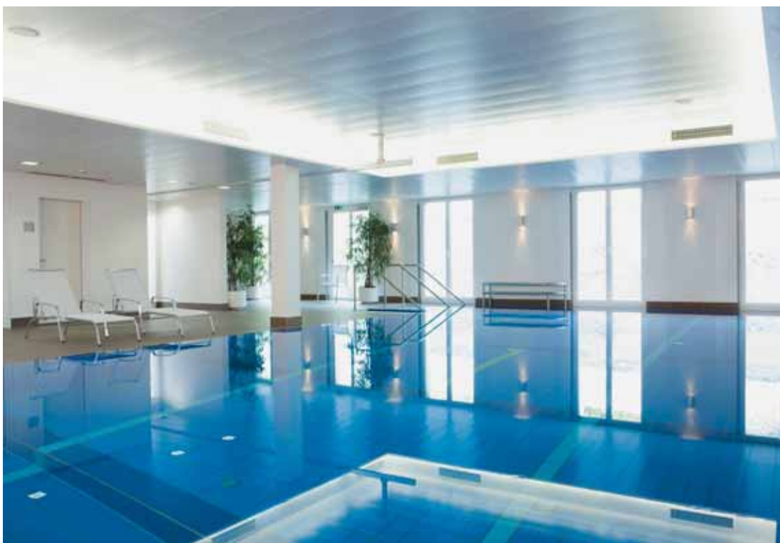
Lebendige Farben im neuen Therapiebad

breiten Spektrum. Unter dem Dach des Therapiezentrums befinden sich unter anderem auch das Swiss Olympic Medical Center und das Medizinische Trainingscenter Benefit/MTT. Neu integriert ins Therapiezentrum ist ein eigenes Thermalbad, das für Wassertherapien genutzt wird.