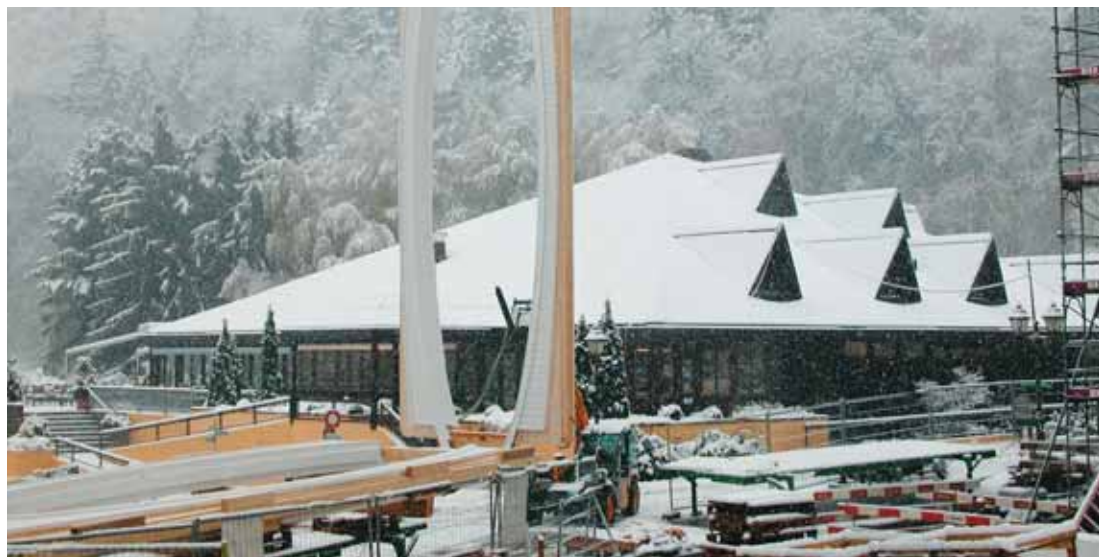
Die Zeit drängt: Abladen und Montage bei jedem Wetter