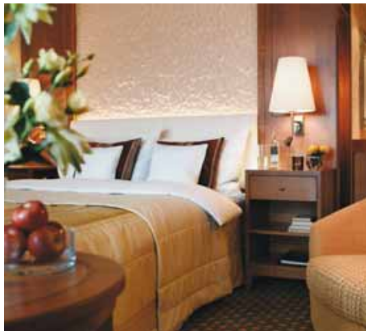
Eleganz und Komfort in den Zimmern

Mit der Wiedereröffnung des Helenabad-Traktes im September 2008 ist der erste Teil der Komplettrenovierung des Grand Hotels Hof Ragaz abgeschlossen. 70 Zimmer und Suiten präsentieren sich in neuem Glanz und verwöhnen den Gast mit besonderem Komfort. Dazu gehören Annehmlichkeiten wie moderne Sony-Flatscreen-Bildschirme und MP3-Anschlüsse, exklusive Kosmetikprodukte der Marke Molton Brown oder duftender Kaffee aus der eigenen Nespresso-Maschine.